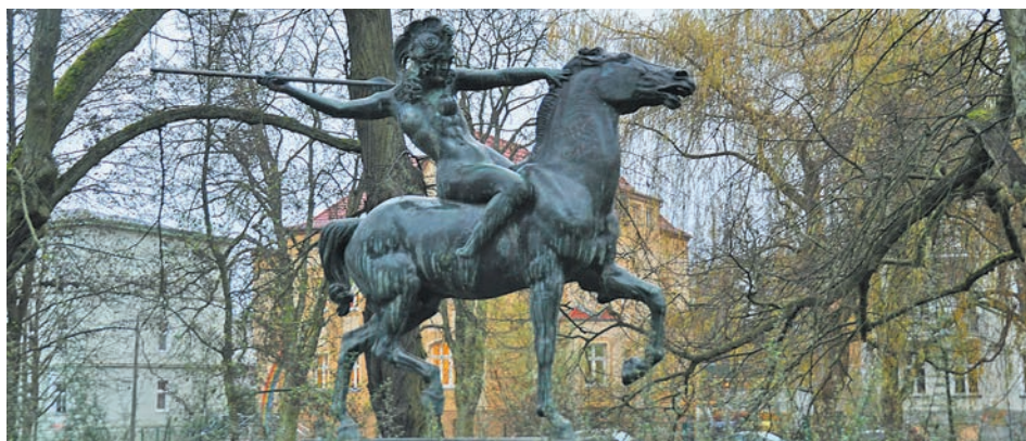
noch zwei weitere Exemplare der Großplastik. Eine befindet sich im Museum Villa Stuck in München, gegossen 1936 und eine weitere in Baldham bei München, ebenfalls gegossen im Jahre 1936. Heike Pankrath - unter Verwendung von Wikipedia

Die etwa lebensgroße Amazone auf galoppierendem Pferd ist eine unbekleidete und mit reich verziertem Helm versehene Kriegerin. Sie hält sich mit der linken Hand an der Mähne des zügellosen Pferdes fest, während ihr rechter Arm weit zum Speerwurf ausholt. Die Amazone ist eine künstlerisch qualitätvolle Plastik im Münchener Jugendstil. Neben der Eberswalder Amazone existieren heute