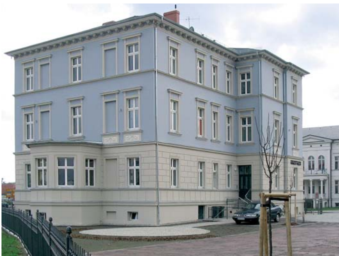
Durch aufwändige Sanierungsarbeiten, wie am Haus in der Eisenbahnstraße 102, hat das Sanierungsgebiet eine Wertsteigerung erfahren.