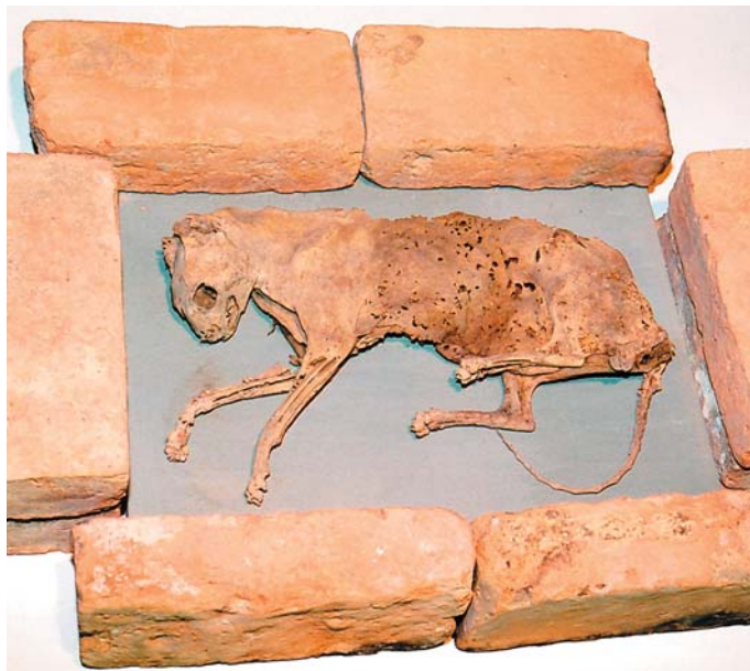
Das versteinerte Tier ist eindeutig als Katze zu erkennen. Früher wurden solche Opfer gebracht, um Bewohner vor Unglück zu bewahren.

Interessantes aus dem Museum in der Adler-Apotheke