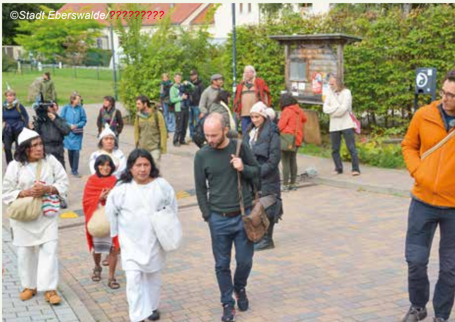
Vier Besucher des indigenen Volkes der Kogis (in weiß gekleidet) aus Kolumbien besuchten im September Eberswalde.

Am Montag, den 19. September um 11 Uhr begann am Waldcampus in Eberswalde ein Waldspaziergang mit Gästen aus Kolumbien. Bei den Besuchern handelte es sich um drei Älteste und einen Dolmetscher aus dem indigenen Volk der Kogi. Die Kogi leben zurückgezogen in den Bergen der Sierra Nevada de Santa Marta an der kolumbianischen Karibikküste.