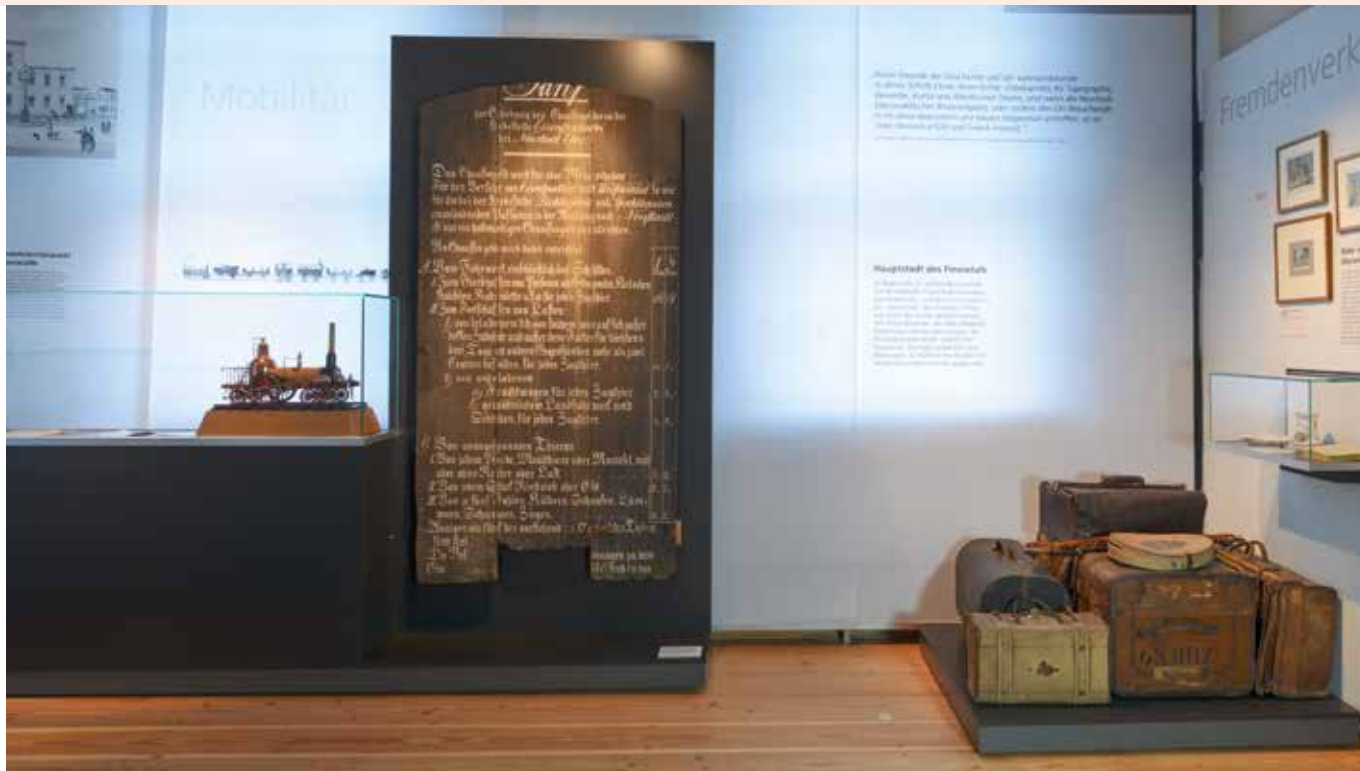
Nachnutzung von amtlichem Schriftgut: Von der Chausseetafel zur Stalltür.