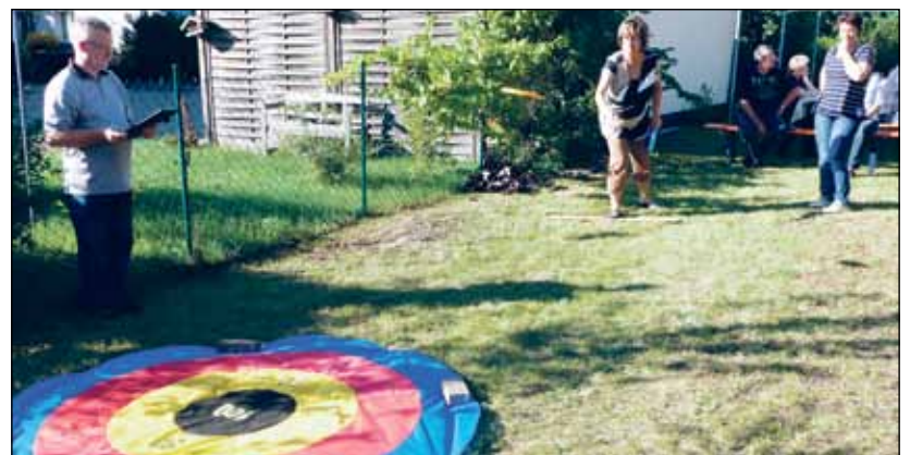
Zielwasser sollte man getrunken haben.