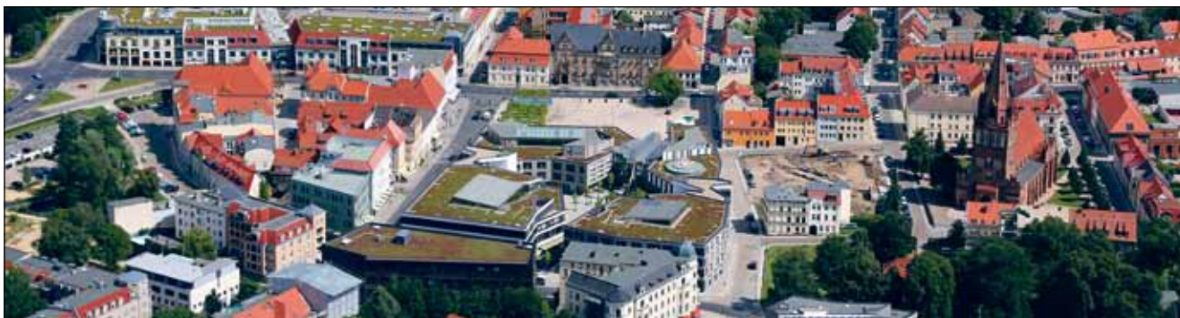
Blick auf das heutige Stadtzentrum von Eberswalde.