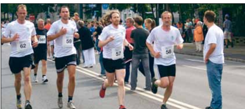
Insgesamt drei Mannschaften der Stadtverwaltung gingen an den Start. Vier Stadt(t)liche liefen gemeinsam ins Ziel.

Auf dem Gelände des Sportzentrums Westend bot das parallele Familienfest vor allem den kleinen Besuchern Spiel und Spaß.