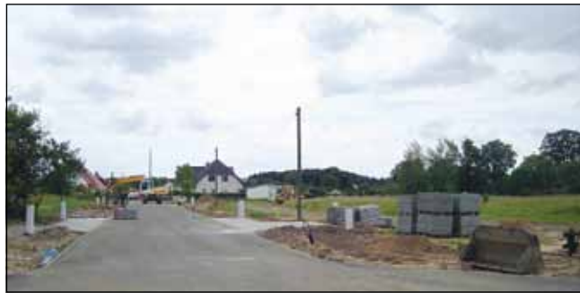
Der erschlossene Teil des Ligusterweges.

Die Stadt Eberswalde bietet Baugrundstücke in der Clara-Zetkin-Siedlung an. Ein neuer Straßenabschnitt des Ligusterweges wurde diesen Sommer fertig gestellt. Die Parzellen verfügen bereits über die nötigen Anschlüsse und sind somit geeignet für den Eigenheimbau. In ruhiger, grüner Lage lässt sich der Traum vom Eigenheim in Eberswalde gut erfüllen. Besonders schnell kommen Interessenten an eine Baugenehmigung, wenn ihr Grundstück bereits in einem Bebauungs-