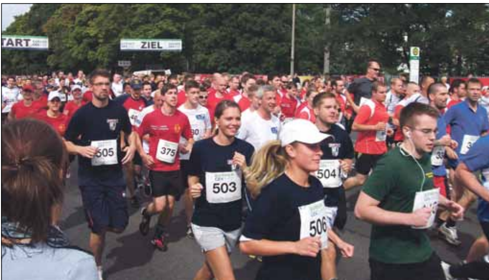
Start zur sieben Kilometer langen Laufstrecke.