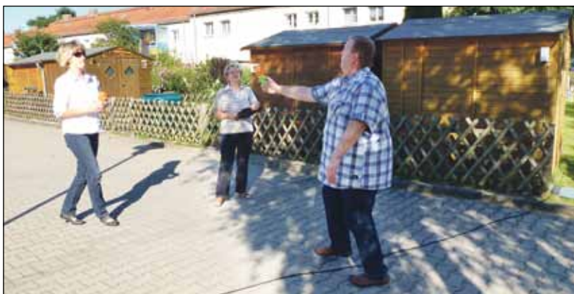
Auch ein Kinderspiel will gekonnt sein.

Die Mieter der Heidestraße 44-64 in Eberswalde