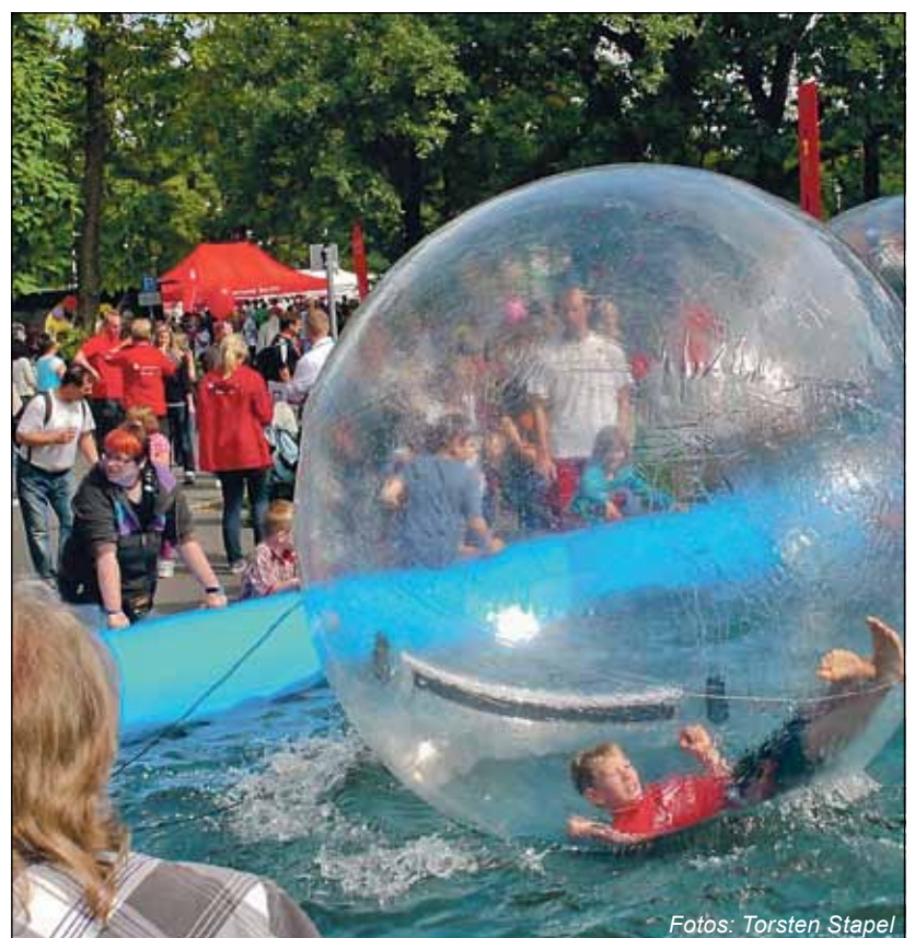
Kinderfest beim Stadtlauf.