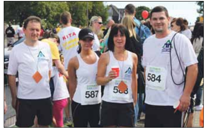
Erschöpft aber glücklich: zufrieden mit den eigenen Laufzeiten präsentierte sich das Team nach dem 7-Kilometer Teamlauf.

Zum fünften Mal in Folge stellten sich Mitarbeiterinnen und Mitarbeiter des ZWA einer Herausforderung der besonderen Art als es hieß: „RAUS aus den Arbeitssachen, REIN in die Laufsachen!“. Gemeinsam absolvierten sie beim 6. Eberswalder Stadtlauf am 2. September 2012 den 7-Kilometer-Firmenlauf nach dem Motto „ZWA – Wasser läuft“.