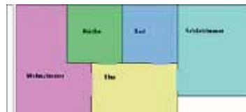
Grundriss Frankfurter Allee 53

2-Raum-Wohnung Straße Frankfurter Allee 53, 16227 Eberswalde Etage 4. OG/links m 2 50,64 Kaltmiete 258,92 € (zzgl. Einbauküche: 7,93 €) zzgl. Nebenkosten 130,00 € Kaution 776,76 € bezugsfertig 15.09.2012 Voraussetzung - Ausstattung gemalert, Aufzug, Balkon, Einbauküche