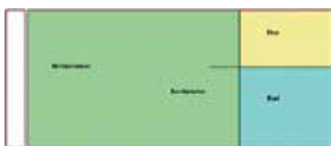
Grundriss Schorfheidestraße 34

1-Raum-Wohnung Straße Schorfheidestraße 34, 16227 Eberswalde Etage 1. OG/links m 2 26,23 Kaltmiete 134,04 € (zzgl. Einbauküche: 0,35 €) zzgl. Nebenkosten 80,00 € Kaution 402,12 € bezugsfertig 15.09.2012 Voraussetzung - Ausstattung gemalert, Aufzug, Einbauküche, Balkon