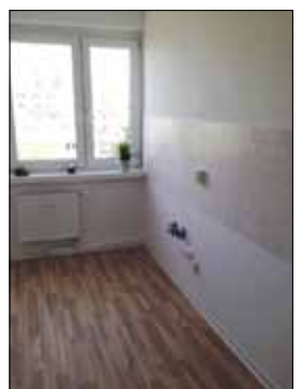
Küche mit Fliesenspiegel