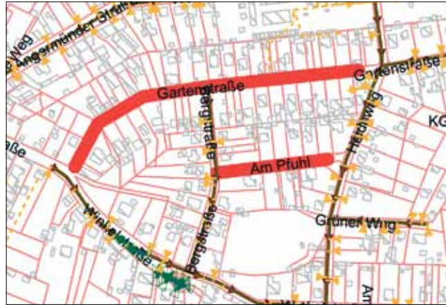
In den rot gekennzeichneten Straßen werden die Schmutzwasserleitungen verlegt.

Nachdem das Bauvorhaben ausgeschrieben worden ist, hat die Vergabe der Bauleistungen an die Fa. TRP Bau GmbH erfolgt. Mittlerweile sind die Bauarbeiten in vollem Gange.