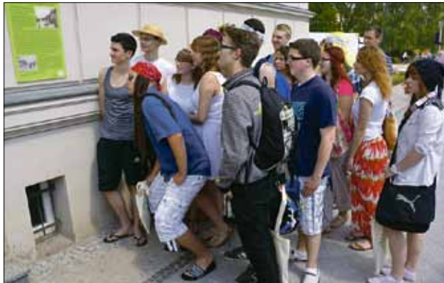
Enthüllung von „Zeitspuren“-Plaketten in Eberswalde: Die 21 Goethe-Schüler der 10c sind der Historie der Eisenbahnstraße nachgegangen.

Der Geschichte der Eisenbahnstraße in Eberswalde haben Goethe-Schüler nachgeforscht. Elf grüne Informationstafeln an prägenden Gebäuden berichten nun von deren Vergangenheit. Gemeinsam mit Vertretern des Vereins für Heimatkunde zu Eberswalde und Bürgermeister Friedhelm Boginski enthüllten die Jugendlichen am 21. Mai ihre Forschungsergebnisse.