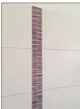
Fliesenmuster heller Wandfliesen mit Mosikdetails

Falls wir Ihr Interesse geweckt haben sollten, können Sie sich gerne an Herrn Lange unter der Telefonnummer 03334/302254 wenden.