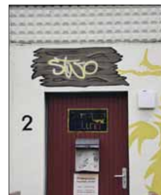
Der Eberswalder Jugendclub Stino soll neu gestaltet werden.

Der Eberswalder Jugendclub Stino soll neu gestaltet werden. Ideen dazu können Jugendliche noch am 19. Juni in einem Workshop einbringen, los geht es um 16 Uhr, Heegermühler Straße 2. Die Jugendkoordinatorin der Stadt, Katrin Forster, lädt alle Kinder und Jugendlichen aus Eberswalde und dem Umland ein, eigene Wünsche vorzutragen. „Was künftig in dem neuen Jugendclub im Zentrum der Stadt geboten wird, das können Jugendliche jetzt mitbestimmen. Dazu kann jeder seine Interessen und Stärken einbringen. Wie können die Räume aussehen, was soll in ihnen gemacht werden? Wie wird das ganze Haus funktionieren? Bei all diesen Entscheidungen sollten Jugendliche dabei sein. Denn sie werden das Haus später nutzen. Ich lade alle jungen Menschen ein, beteiligt Euch beim Denken, Planen und Entscheiden!“, so die Jugendkoordinatorin. Das bisher nur zum Teil als Jugendclub genutzte Gebäude an der Heegermühler Straße soll künftig ausschließ-