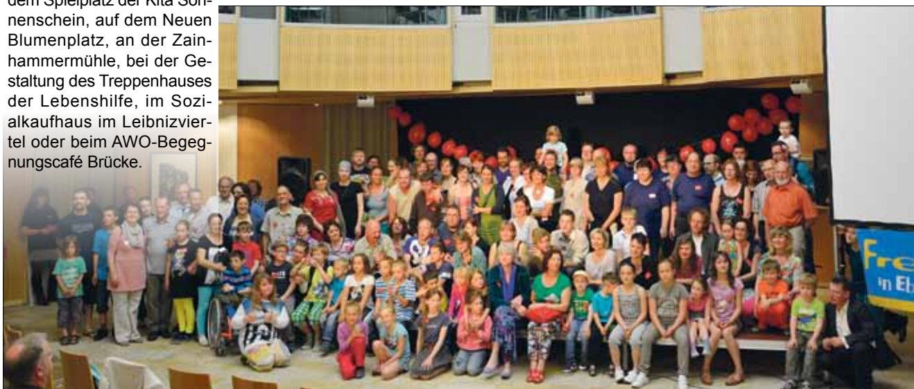
Freiwilligentag in Eberswalde: Viele der fleißigen Helfer waren zur Dankeschön-Party ins Paul-Wunderlich-Haus gekommen.