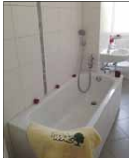
Tageslichtbad mit Badewanne – Blick ins Wohnzimmer – Heller Innenflur