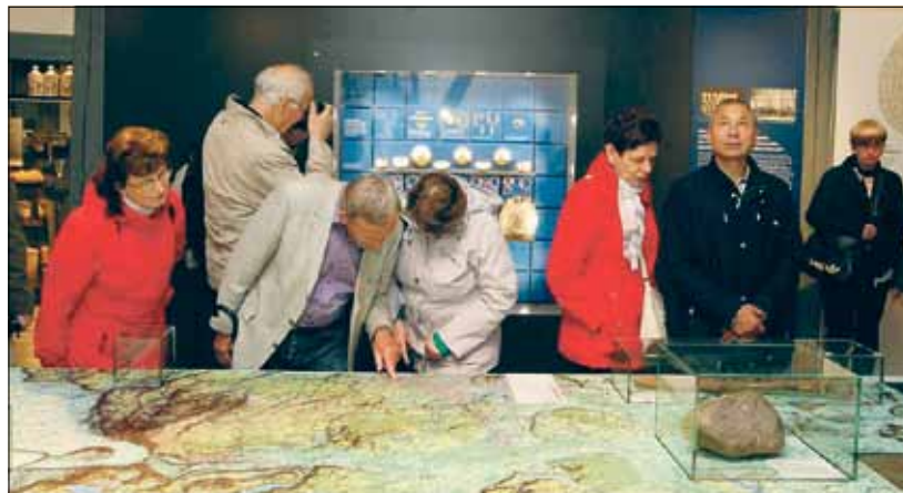
Blick in die neugestalteten Museumsräume, im Hintergrund die Vitrine mit der Kopie des Eberswalder Goldschatzes.