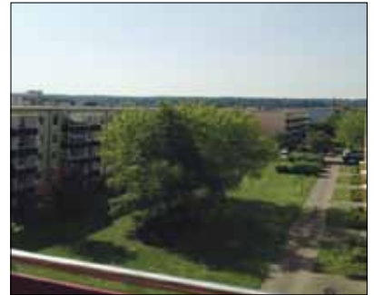
Balkonaussicht mit Weitblick

Die energetische Sanierung und Modernisierung der beiden Wohngebäude A.-v.-Humboldt-Str. 17-25 und 27-35 konnte im März 2014 abgeschlossen werden. Die Wohnblöcke erstrahlen nun in einem neuen „Glanz“. Technisch, farblich, frisch. In den Jahren 2011 bis 2014 wurden in insgesamt 100 Wohnungen umfangreiche werterhaltende und wertverbessernde Sanierungs- und Instandhaltungsarbeiten durchgeführt. Die an den Baumaßnahmen beteiligten überwiegend regionalen Firmen haben hier in jeglicher Hinsicht gute Qualität in der Ausführung, Souveränität und Zuverlässigkeit bewiesen. Mit der energetischen Gebäudesanierung und der Fassadendämmung, nach den gesetzlichen Bestimmungen der Energieeinsparverordnung, mit dem Ziel der Einsparung von Energie, wurde im Jahr 2011 begonnen. Die vorhandenen teilweise stark verschlissenen Balkone wurden während der Fassadenarbeiten gegen größere Balkone mit verbesserter Freifläche zu Erholungszwecken ausgetauscht. Im Jahre 2013 setzten sich die Arbeiten innerhalb des Gebäudes fort. Im Zuge der Strangsanierung erhielten alle Wohnungen neue Trinkwasser-, Schmutzwasser- und teilweise auch Heizungsleitungen. Hier haben uns die Mieterinnen und Mieter bei der technischen Bewältigung dieser logistischen Herausforderungen hervorragend unterstützt.