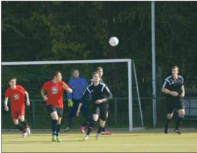
Spannende Fußballspiele beim Cliquen-Cup im Westendstadion

Auch in diesem Jahr war der sogenannte Cliquen-Cup wieder ein voller Erfolg. Gut 80 Jugendliche und junge Erwachsene hatten dafür am 16. Mai die Fußballschuhe geschnürt und sich