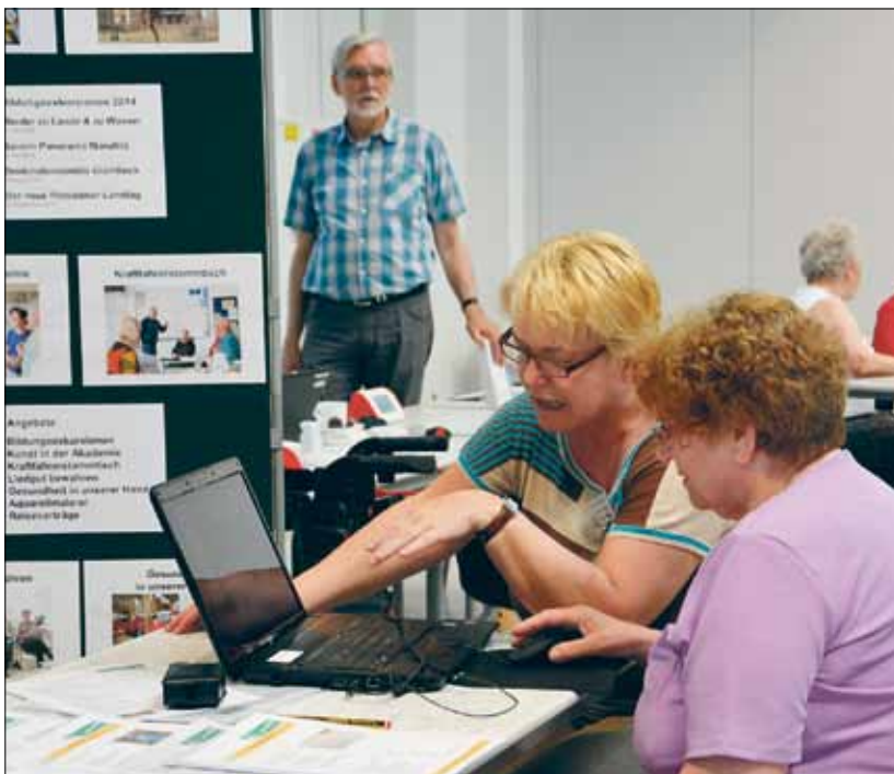
Der erste Eberswalder Seniorentag hatte am 26. Mai über altersspezifische Angebote der Vereine und Institutionen vor Ort informiert.