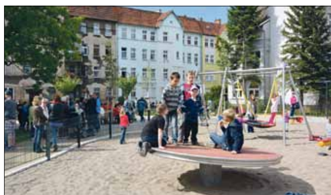
Frohes Treiben bei der Eröffnung des Spielplatzes.

Sitzmöglichkeiten wurden Abfallkörbe (auch für Hundekot) sowie Fahrradständer installiert. Die Gesamtfläche umfasst 2.200 Quadratmeter. Der Kinderspielbereich wurde erweitert und erhielt einen Sandspielbereich, zwei Federwippgeräte, ein Kleinkindspielhaus, einen Spielturn mit Rutsche und Kletterwand, eine Doppelschaukel als Nestschaukel mit Einfachschaukel, eine Balkenwippe und eine Drehscheibe. Der Bereich für die Jugendlichen wurde mit einem Schwingtisch, einer neuen Streetballanlage und der vorhandenen Tischtennisplatte ausgestattet. Die Spiel- und Liegewiese ist mit einem Trampolin aufgewertet worden. Für die Planung war das Büro für Landschaftsplanung Günther Schiemann aus Berlin verantwortlich, bauausführende Firma war die Tief- und Straßenbau GmbH THARO aus Eberswalde. Die Kosten der Umgestaltung betragen ca. 300.000 Euro. Davon Zweidrittel aus dem Programm Stadtumbau Ost und Eindrittel aus dem Stadthaushalt.