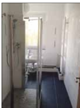
Bodengleicher Echtglasdusche – moderne Sanitärkeramik – Hänge-WC