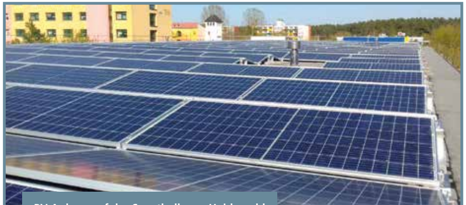
PV Anlage auf der Sporthalle am Heidewald

Jedes Jahr fällt so viel Sonnenenergie auf Brandenburgs Dächer, dass der gesamte Stromverbrauch des Landes theoretisch damit gedeckt werden könnte. 24.092 Gigawattstunden Stromerzeugung wären laut Energieagentur Brandenburg möglich, tatsächlich genutzt wird derzeit nur ein Bruchteil. Daher ist es sinnvoll diese Energie noch stärker dezentral zu nutzen und auch als Privatperson mit Photovoltaikanlagen einzufangen. Hier können langfristig Kosten und Treibhausgasemissionen eingespart werden, welche so einen Beitrag zum Ziel der Klimaneutralität bis 2045 leisten.