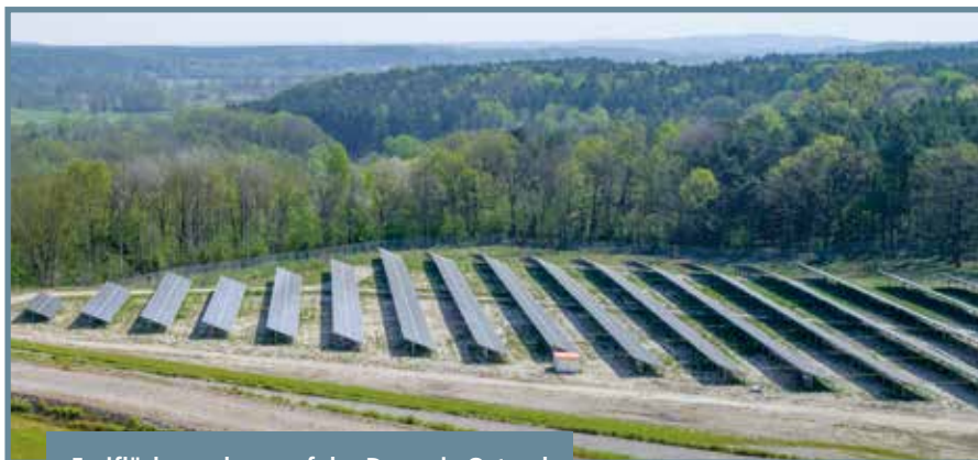
Freiflächenanlage auf der Deponie Ostend

Unterm Strich sind viele nachhaltige Energieformen nicht nur besser für das Klima, sondern auch kostengünstiger. Zu bedenken ist, dass die Sonne oder die Wärme der Erde nicht teurer wird, lediglich die Anschaffungs- und Wartungskosten verändern sich. Bei jedem Hausbau sollten moderne Technologien zur dezentralen Energieversorgung sowie Energieeffizienz mitbedacht werden – zum Beispiel nach Süden ausgerichtete Dachflächen oder eine gute Wärmedämmung, aber auch bei bereits gebauten Häusern gibt es viel Optimierungspotenzial. Weitere Informationen für Bauvorhaben unter: https://www.eberswalde.de/nachhaltiges-bauen .