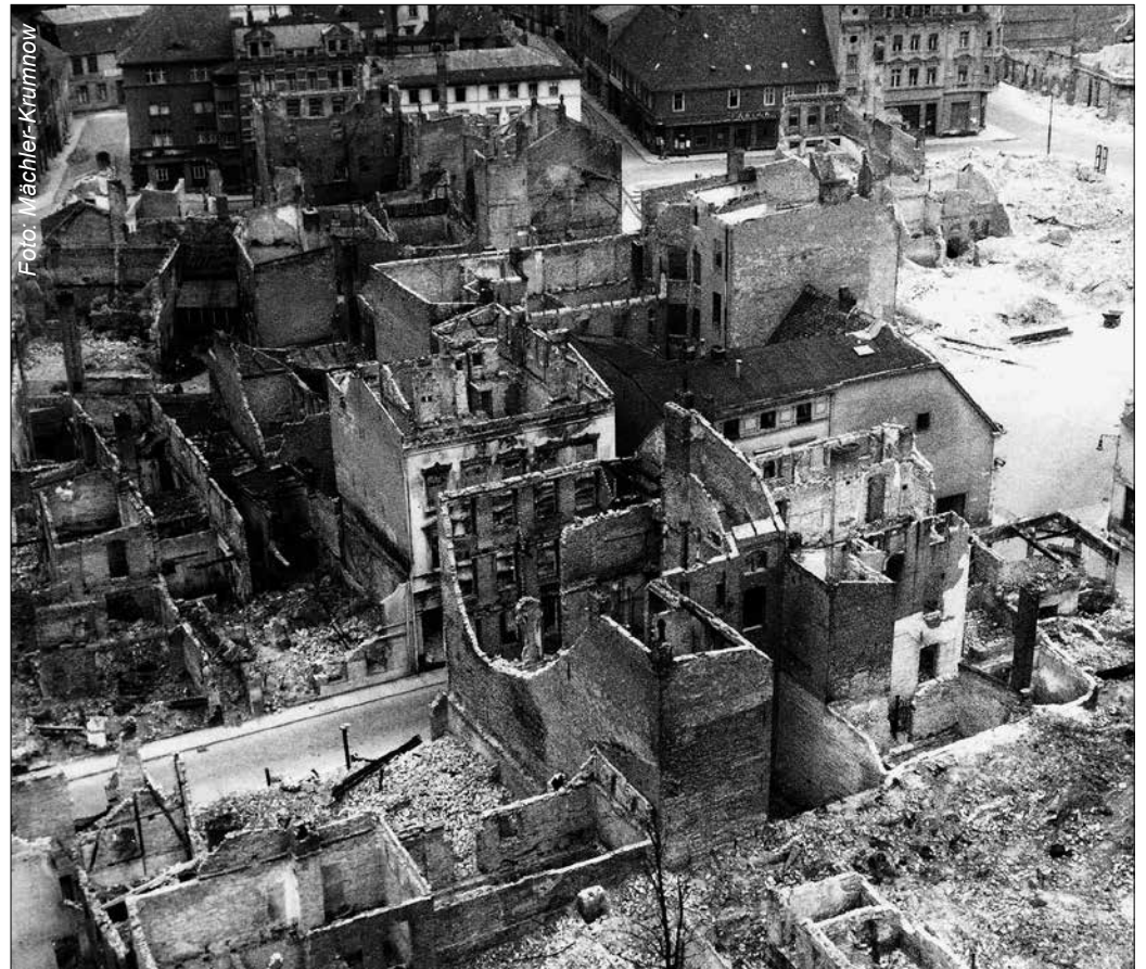
Das Stadtzentrum bot nach den Luftangriffen zum Ende des Zweiten Weltkrieges ein Bild der Zerstörung.

waren 27 Millionen Einwohner der Sowjetunion, darunter 14 Millionen Zivilisten. Gewaltige Zahlen, die einen in ihren unfassbaren Dimensionen auch heute noch berühren. Auch in Deutschland und in Eberswalde hatte der Krieg fatale Auswirkungen. 6,5 Millionen Deutsche starben durch den Zweiten Weltkrieg. Praktisch jede Familie hatte einen Gatten, Sohn oder Bruder auf den Schlachtfeldern verloren. Dazu kam das Leid der Zivilbevölkerung. Auch in Eberswalde hinterließ der Zweite Weltkrieg seine Spuren, nicht nur in den familiären Tragödien, sondern auch im Stadtbild. Ein Drittel der Bebauung von Eberswalde wurde in den letzten Wochen des Krieges durch die deutsche Luftwaffe zerstört. Bis heute arbeiten wir daran, diese Lücken in unserer Stadt zu schließen. Auf diesem Weg liegt noch viel Arbeit vor uns, aber wir haben auch schon wunderbares geschaffen. Nach dem Ende des Krieges entwickelte sich in Deutschland eine starke Erinnerungskultur, die bis heute Bestand hat. Gemeinsam mit