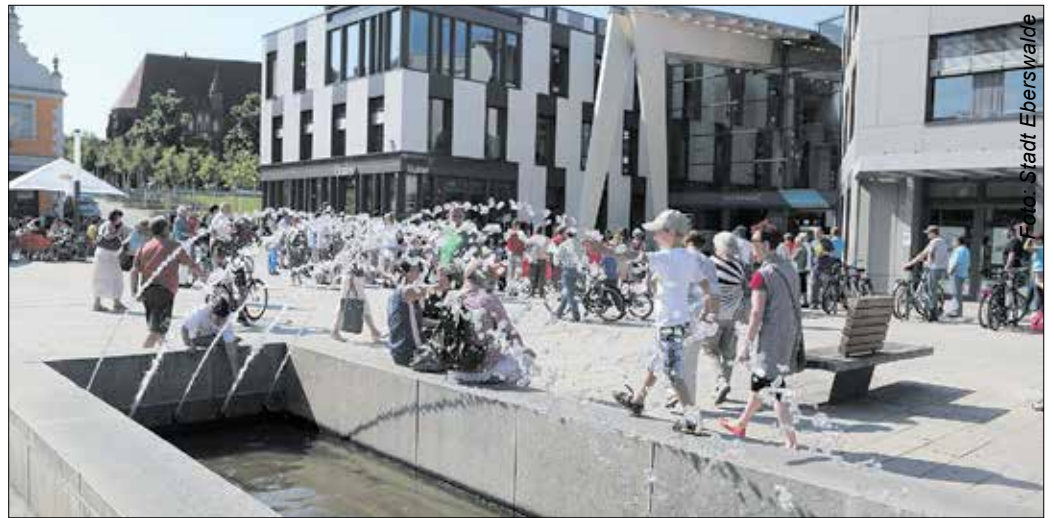
Auf dem Eberswalder Marktplatz sind der Löwenbrunnen und der Stadtbrunnen wieder in Betrieb.

Der Löwenbrunnen hatte es in früheren Zeiten besonders den Studenten der Forstlichen Hochschule in Eberswalde angetan. Neuzugänge der Universität wurden mit dem Wasser des Brunnens getauft. Inzwischen lässt die Stadt zum alljährlichen Studentenempfang Bier statt Wasser aus dem Brunnen fließen.