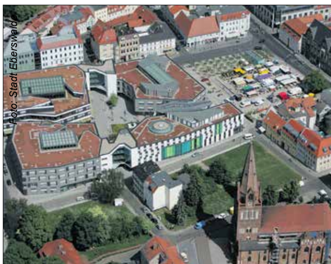
Eberswalde hat sich zu einem Ort mit hoher Lebensqualität entwickelt und ist nach wie vor beliebt.

Eberswalde hat sich zu einem Ort hoher Lebensqualität im Nordosten Brandenburgs entwickelt. Die sanierten Stadtteile transferieren modernisiert und wiederhergestellt die Geschichte der Stadt in unsere Zeit. Gleichzeitig ergänzen moderne Neubauten das Stadtbild und werten es auf. Die Stadtverwaltung erteilte 2018/2019 135 Baugenehmigungen für Ein- und Mehrfamilienhäuser mit 261 Wohneinheiten im Eberswalder Stadtgebiet. Im gleichen Zeitraum verkaufte das städtische Liegenschaftsamt 27 Baugrundstücke, auf denen sich Käufer und Käuferinnen jetzt ihre Bauwünsche