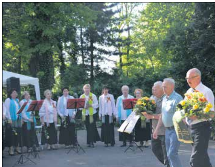
Am 8. Mai findet jährlich die Kranzniederlegung am sowjetischen Ehrenmal auf dem Waldfriedhof statt.

Für uns, die Nachgeborenen, ist der 8. Mai ein Tag des Erinnerns und Gedenkens. Mehr als 60 Millionen Menschen verloren ihr Leben während des Zweiten Weltkriegs, davon