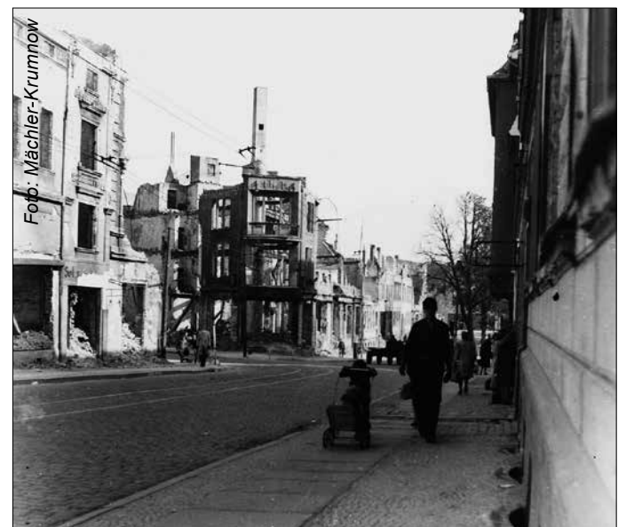
Nach der Befreiung: Die im Museum Eberswalde erhaltenen Fotos aus dem Jahre 1946 zeigen die starken Schäden in der Stadt.

der Sowjetunion und ihren Nachfolgestaaten sowie den Alliierten aus Großbritannien, Frankreich und den USA halten wir die Erinnerung und die Mahnung lebendig. Traditionell gedenken wir dem Kriegsende durch die Niederlegung von Kränzen am sowjetischen Ehrenmal auf dem Waldfriedhof Eberswalde. Auf Grund der aktuellen Situation rund um das Corona-Virus muss diese gemeinsame Erinnerung in diesem Jahr andere Mittel und Wege finden. Es ist sehr wichtig, sich an diesen Krieg und das Leid, welches alle beteiligten Nationen durchlebt haben, zu erinnern. Nur durch die Erinnerung an die Befreiung und die vielen Opfer haben wir die Chance, dass sich Geschichte nicht wiederholt. Obwohl nur noch wenige Zeitzeugen direkt von ihren Erlebnissen berichten können, gibt es mit der Nachkriegsgeneration, zu der ich auch selbst zähle, viele Menschen, welche die Kriegsschäden und -folgen in ihrer Kindheit und Jugend noch hautnah miterlebt haben. Schon früh war für mich klar, dass es das Ziel meines