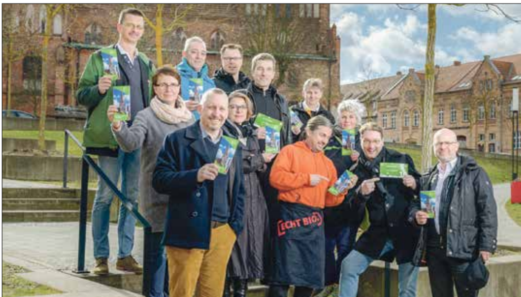
In über 30 Annahmestellen kann mit dem Geschenkgutschein „Der Eberswalder“ eingekauft werden.

„Der Eberswalder“ Geschenkgutschein ist erhältlich bei City Kaufhaus Herber und im Centerbüro in der Rathauspassage Eberswalde, sowie in der Tourist-Information Eberswalde in der Steinstraße 3.