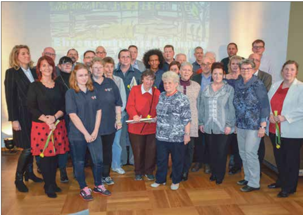
In diesem Jahr wurden insgesamt 34 Personen und Institutionen für ihr ehrenamtliches Engagement in der Stadt Eberswalde geehrt.

Im Bürgerbildungszentrum Amadeu Antonio wurden am 19. März 2019 die Ehrenamtsauszeichnungen vorgenommen. 34 Personen und Institutionen wurden in diesem Jahr von der Stadt Eberswalde für ihr ehrenamtliches Engagement geehrt. „Das Ehrenamt ist keine Selbstverständlichkeit. Als Stadt ist es unser ureigenes Interesse, das Ehrenamt zu fördern“, so Bürgermeister Friedhelm Boginski in seiner Ansprache. „Dass wir am heutigen Abend die engagierten Bürgerinnen und Bürger