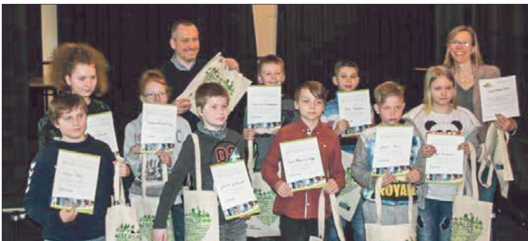
Die Schülerinnen und Schüler der Karl-Sellheim-Schule freuten sich über den Sonderpreis für die erfolgreiche Teilnahme am Höhenpass des Amtes für Wirtschaftsförderung und Familiengarten.