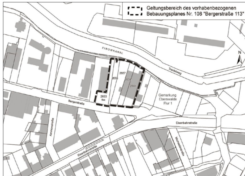
Übersichtsplan (unmaßstäblich) Vorhabenbezogener Bebauungsplan Nr. 108 „Bergerstraße 113“