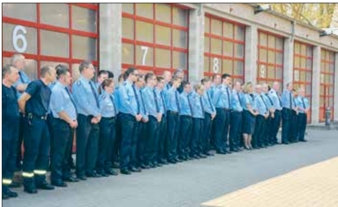
Die Kameradinnen und Kameraden der Freiwilligen Feuerwehren in Erwartung ihrer neuen Fahrzeuge.