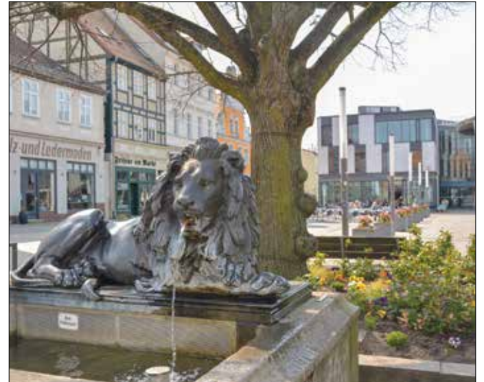
Seit Anfang April sprudelt aus dem Löwenbrunnen auf dem Eberswalder Marktplatz wieder Wasser.

Studenten der Forstlichen Hochschule in Eberswalde angetan. Neuzugänge der Universität wurden mit dem Wasser des Brunnens getauft. Inzwischen lässt die Stadt zum alljährlichen Studentenempfang Bier statt Wasser aus dem Brunnen fließen. Ebenso wurden auch die anderen öffentlichen Brunnen Anfang April wieder in Betrieb genommen. Dies betrifft die Steinschwärze auf dem Marktplatz, die Wasseranlage auf dem Spielplatz Michaelisstraße sowie die Quelle im Park am Weidendamm, vielen auch bekannt als „Schnurrbart Lieschens Loch“.