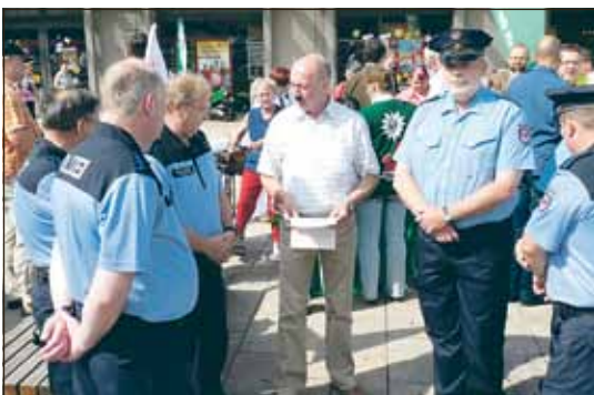
Juli: BM und Fraktionsvorsitzende unterschrieben am 6.7. eine Protestresolution gegen die geplante Schließung der Polizeiwache.