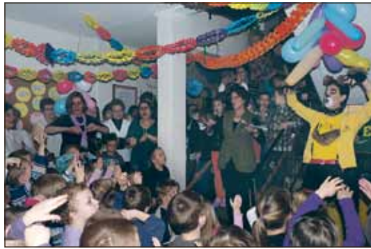
Februar: Die Kita „Pustelblume“ in der Finower Ringstraße 183 beging ihren 35. Geburtstag. Sie ist eine von 11 städtischen Kitas.