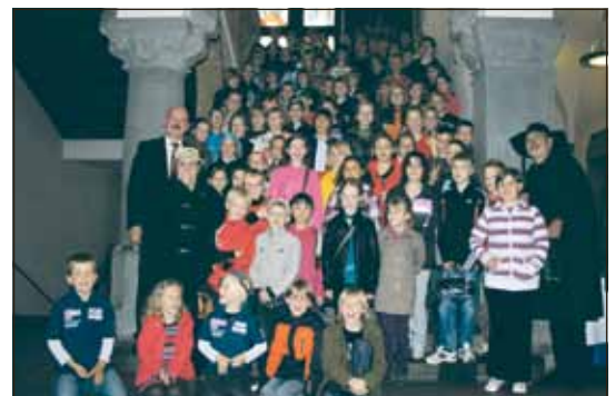
September: 60 engagierte Kinder aus den Grundschulen und Sportvereinen begrüßte der Bürgermeister am 20.9., dem Weltkindertag, zum ersten Kinderempfang im Rathaus.