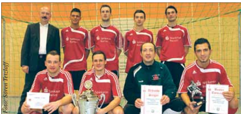
Stolzer Gewinner des Pokals: die Motoraner mit Bürgermeister.

Am 29. Dezember 2010 fand zum 21. Mal das Hallenfußballturnier um den Pokal des Bürgermeisters der Stadt Eberswalde statt. Zum 6. Mal hintereinander gewann der FV Motor Eberswalde dieses Turnier. Näheres: www.kfv.barnim.de