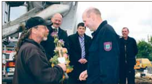
Mai: Der Grundstein für den Neubau der FFW Eberswalde am Schneidemühlenweg wurde am 27.5. gelegt. Eine 1,0 Mio. Euro-Investition aus dem KII-Paket.