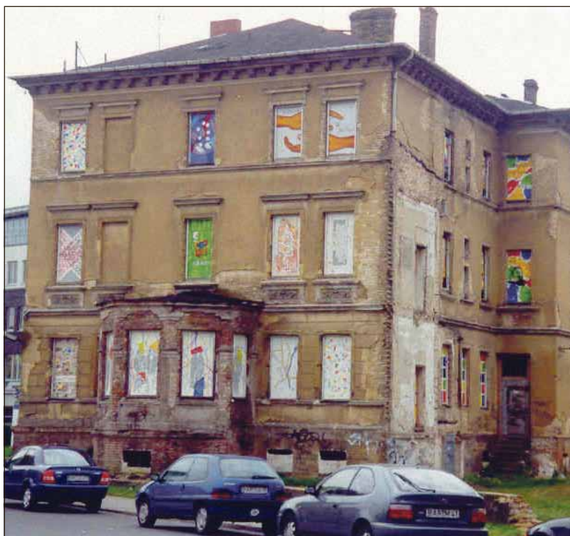
Eisenbahnstraße 102 vor der Sanierung