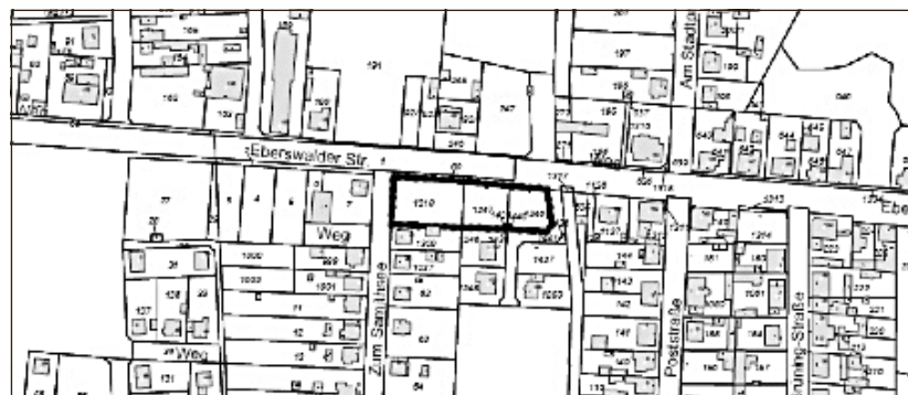
Übersichtsplan (unmaßstäblich) über den Geltungsbereich der 3. Änderung des Bebauungsplanes Nr. 608 „Märkische Heide I“