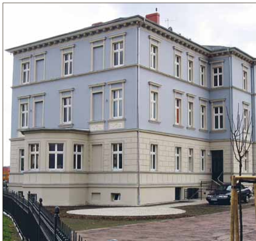
Eisenbahnstraße 102 nach der Sanierung

Schaut man sich um im Eberswalder Stadtzentrum, sieht jeder, der Eberswalde schon länger kennt, wie viel sich in den letzten Jahren verändert hat. Erst wenn man alte Bilder oder Postkarten ansieht, erinnert man sich, wie es hier einmal aussah. Allein im Altstadtgebiet, rund um den Marktplatz, gibt es viel Neues zu sehen und zu erleben. Die Einwohner von Eberswalde und ihre Besucher fühlen sich wohl im wiederbelebten Zentrum.