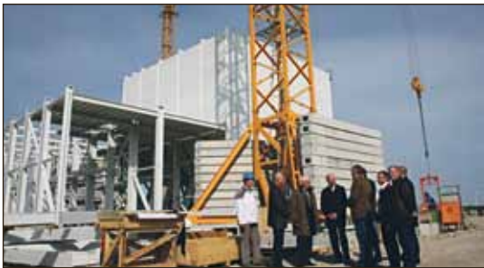
April: Baustellenbesuch bei der MEGA Tierernährung am 20.4. Für Frühjahr 2011 ist der Produktionsstart der 17,5 Mio-Investition mit 40 Arbeitsplätzen geplant.