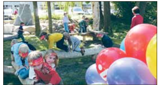
Juni: Neuer Spielbereich zwischen Goethe- und Michaelisstraße seit 4.6. – für rund 507.000 Euro gefördert von Bund und Land.