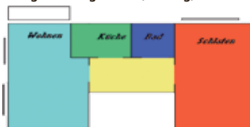
Grundriss Frankfurter Allee 33

Straße Frankfurter Allee 33, 16227 Eberswalde Etage 3. OG/links m 2 59,31 Kaltmiete 293,72 € (zzgl. Einbauten: 0,82 €) zzgl. Nebenkosten 130,00 € Kaution 881,16 € bezugsfertig 01.01.2011 Voraussetzung Ausstattung gemalert, Aufzug, Balkon