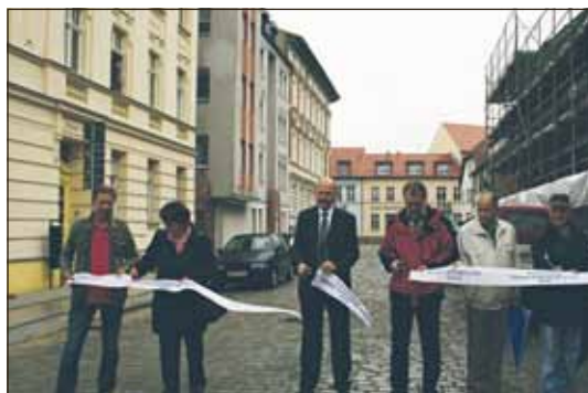
August: Die komplett sanierte Salomon-Goldschmidt-Straße rundet das Quartier um die Maria-Magdalenen-Kirche seit 27.8. ab – für rund 270.000 €, gefördert von Bund und Land.