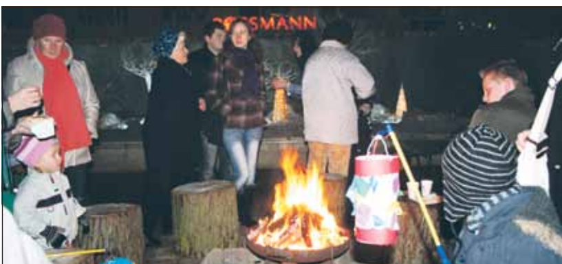
Zahlreiche Gäste hatte der kleine, aber feine Eberswalder Weihnachtsmarkt – mit viel Kultur, Märchenjurte und Saunamobil.