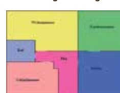
Grundriss Ringstraße 54, Haus 1

Straße Ringstraße 54, Haus 1, 16227 Eberswalde Etage EG/links m 2 83,09 Kaltmiete 407,81 € (zzgl. Antennengeb.: 7,79 €) zzgl. Nebenkosten 169,41 € Kaution 1.223,43 € bezugsfertig 01.01.2011 Voraussetzung Ausstattung gemalert, Terrasse, Aufzug