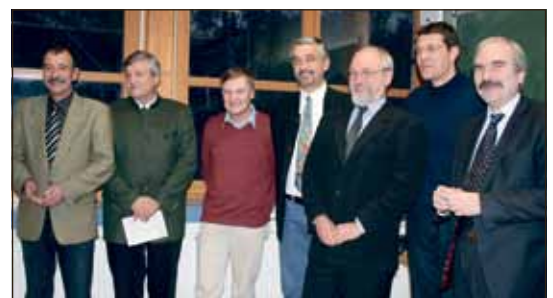
Dezember: Die offizielle Gründung der gemeinsamen Stiftung WaldWelten verkündeten am 2.12. Stadt und Hochschule- im Beisein von Staatssekretär Martin Gorholt.