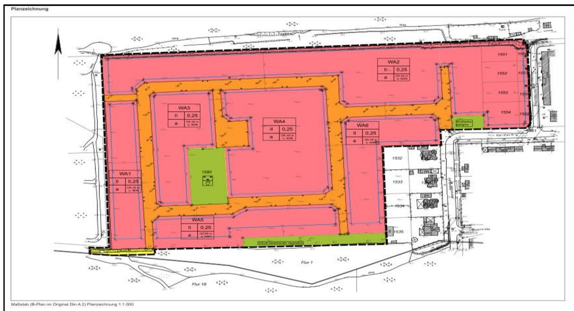
Abb. 1: Auszug BPL-Nr. 606 - Christel-Brauns-Weg

( https://www.eberswalde.de/start/stadtentwicklung/bebauungsplanung )